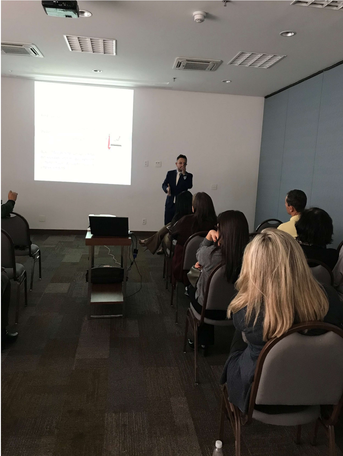
Figura 8 – Apresentação da posição de encerramento da carteira de Investimentos do Instituto pela empresa Crédito & Mercado