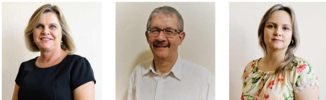
Figura 5 - Membros do Comitê de Investimentos