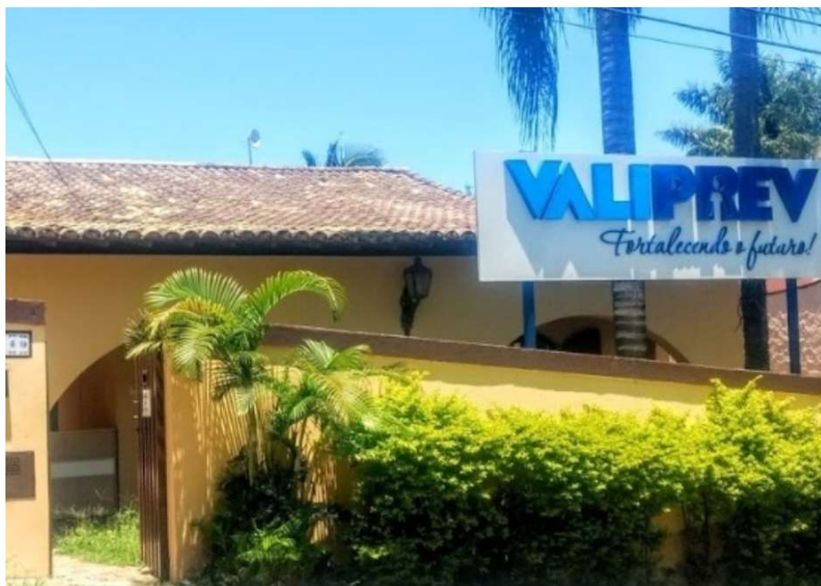
Figura 1 - Sede do RPPS

Foi criado em 01 de agosto de 2013, pela Lei Municipal nº 4.877 de 11 de julho de 2013.