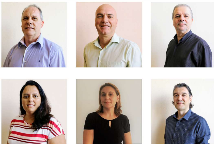
Figura 2 - Membros do Conselho Administrativo do RPPS