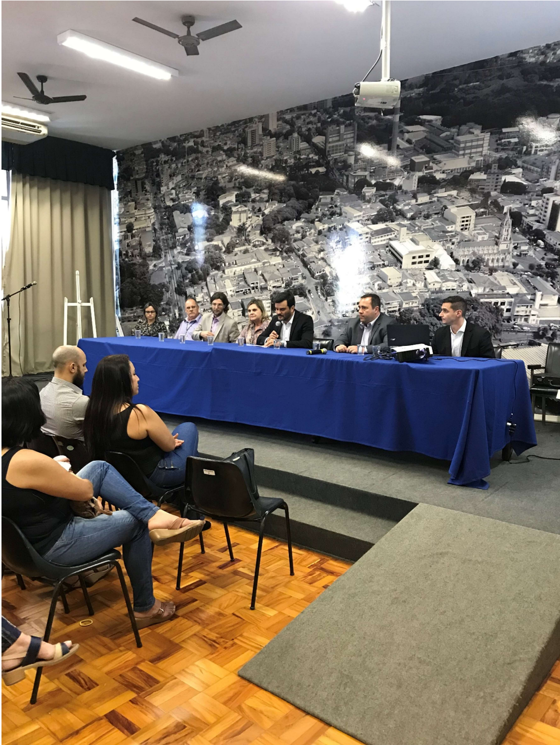
Figura 7 – Apresentação do Cálculo Atuarial pela ETAA